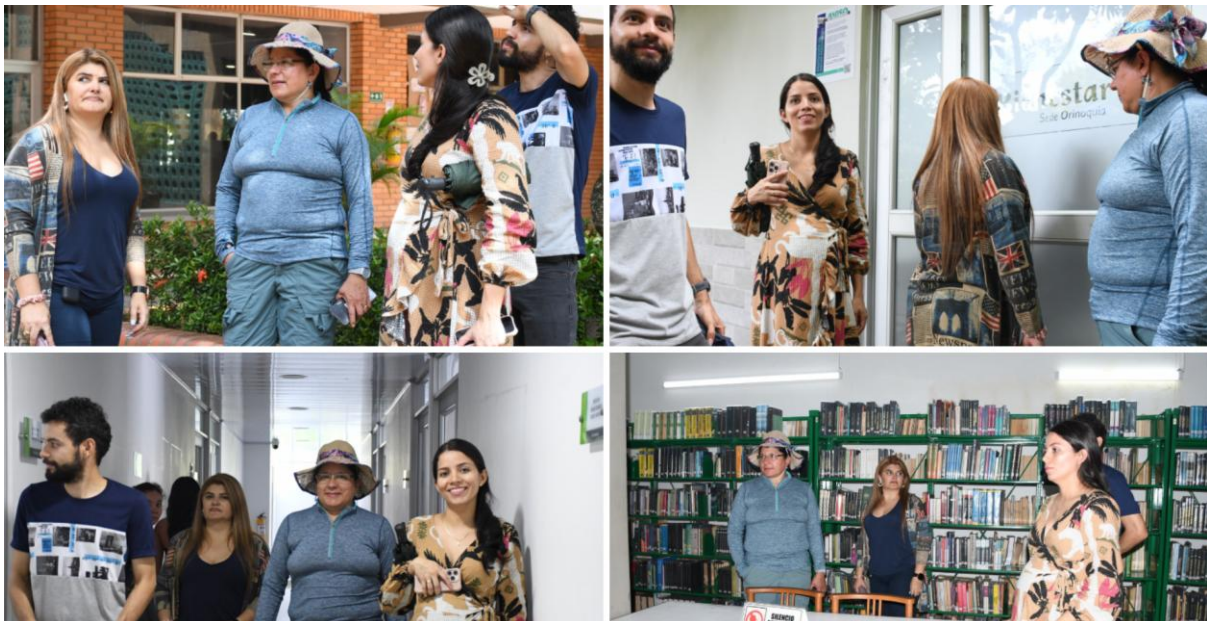
Recorrido por espacios académicos y de bienestar del campus Orinoquia, incluyendo la biblioteca y áreas destinadas al acompañamiento estudiantil.

La jornada inició a las 8:00 de la mañana con un espacio de bienvenida dirigido a los participantes del encuentro, seguido de un recorrido guiado por las instalaciones del campus de la Universidad Nacional de Colombia, sede Orinoquia. Durante esta actividad, los asistentes tuvieron la oportunidad de conocer de primera mano los distintos espacios que conforman la vida académica y comunitaria de la sede.