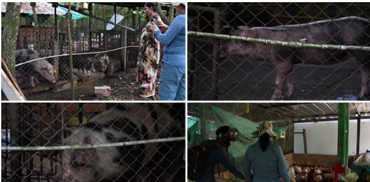
Visita a las unidades de producción porcina y avícola de la granja experimental de la Universidad Nacional de Colombia, sede Orinoquia.

Este proceso representa una estrategia importante para la reducción de residuos y, al mismo tiempo, para la generación de insumos naturales que contribuyen al mejoramiento de la fertilidad del suelo en los cultivos desarrollados dentro de la granja experimental. De igual manera, se resaltó el papel del compostaje como una práctica clave dentro de los principios de la economía circular y la gestión sostenible de residuos, ya que permite reincorporar nutrientes al suelo y disminuir los impactos ambientales asociados a la disposición inadecuada de los residuos orgánicos.