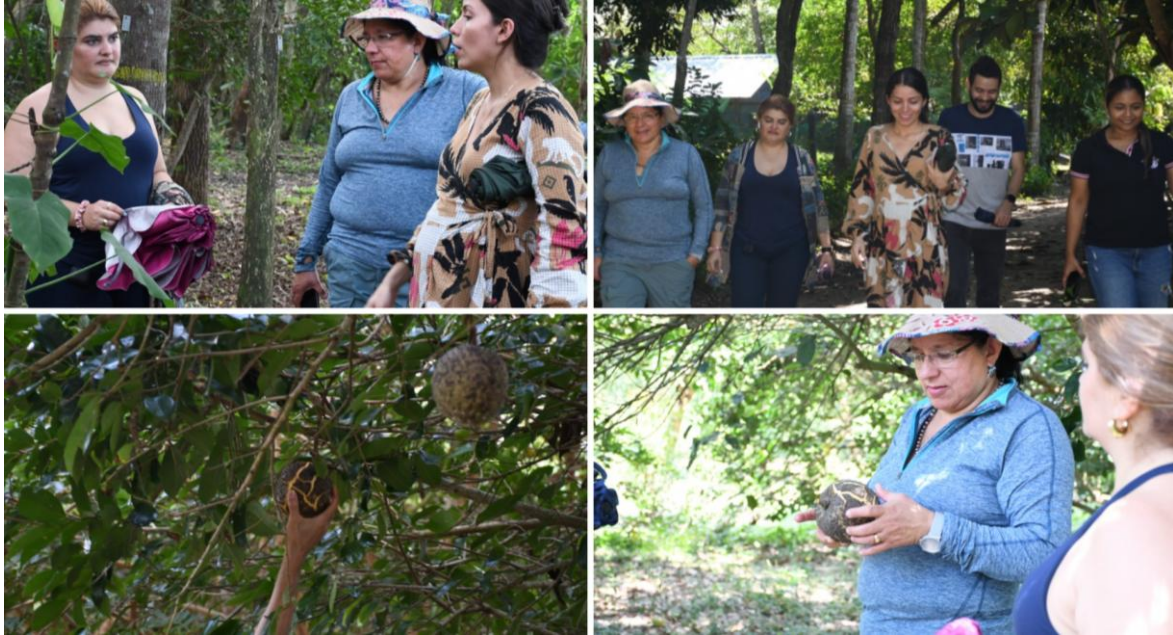
Uso de abono orgánico proveniente del compostaje en cultivos frutales de la granja experimental.

microorganismos beneficiosos para el proceso. A esta mezcla se le agregan soluciones orgánicas elaboradas con melaza, agua de panela o lactobacilos, que favorecen la actividad microbiana y aceleran la descomposición del material. Las pilas se cubren con plástico para conservar la humedad y aumentar la temperatura interna, que puede superar los 50 °C, lo cual acelera la transformación del material orgánico.