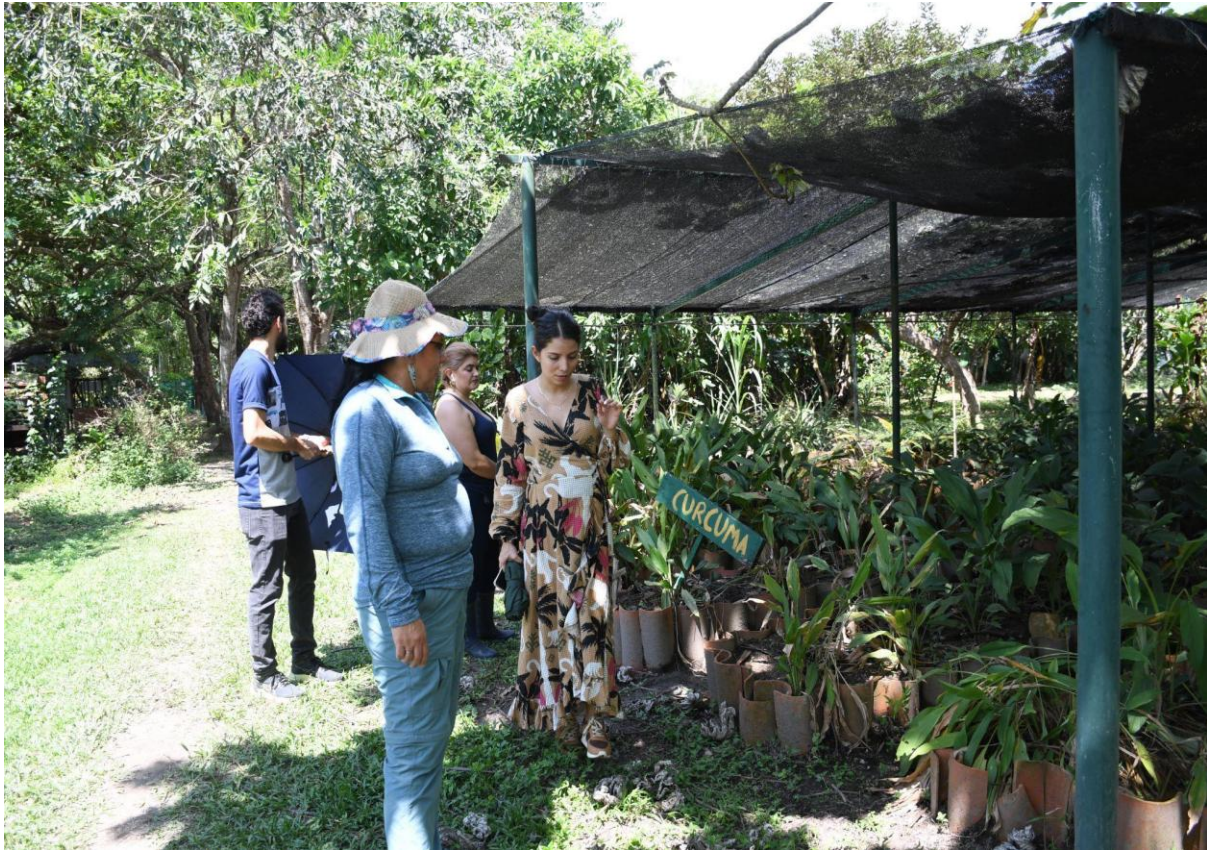
Cultivos de la granja experimental fertilizados con biofertilizantes provenientes del efluente generado en el biodigestor.