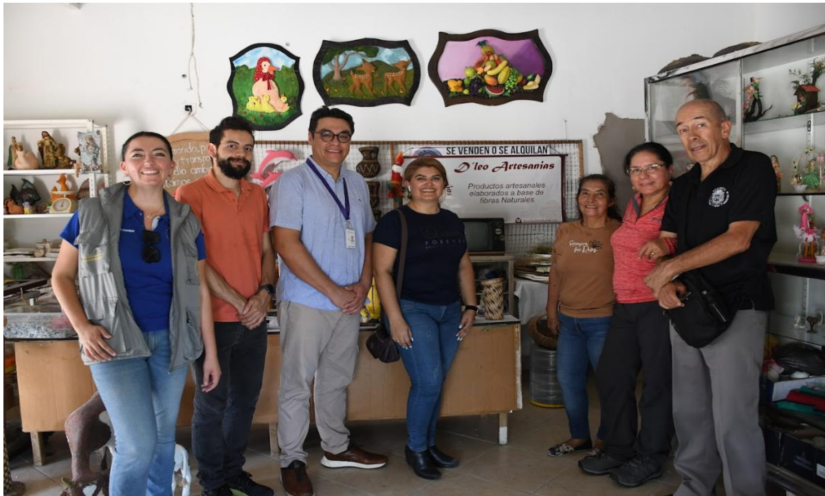
Miembros de la Red de Valorización de Residuos (REDVAR) junto a la artesana de D'Leo Artesanías durante la visita a la comunidad.

La artesana explicó que parte de su labor consiste en enseñar a las nuevas generaciones la importancia de separar los residuos, reutilizar materiales y comprender el impacto ambiental de los desechos. A través de talleres y actividades en la Casa de la Cultura, busca sembrar en los niños una conciencia sobre el cuidado del medio ambiente y el aprovechamiento creativo de los recursos disponibles.