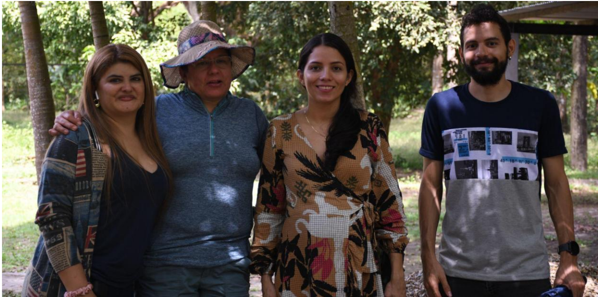
Momento de bienvenida a algunos de los integrantes de la Red de Valorización de Residuos (REDVAR) al inicio de la jornada del encuentro.

El primer día del Segundo Encuentro de la Red de Valorización de Residuos – REDVAR, se desarrolló en las instalaciones del campus de la Universidad Nacional de Colombia, sede Orinoquia, donde se llevaron a cabo diversas actividades orientadas a fortalecer el intercambio académico, el reconocimiento del territorio y el diálogo entre los miembros de la red.