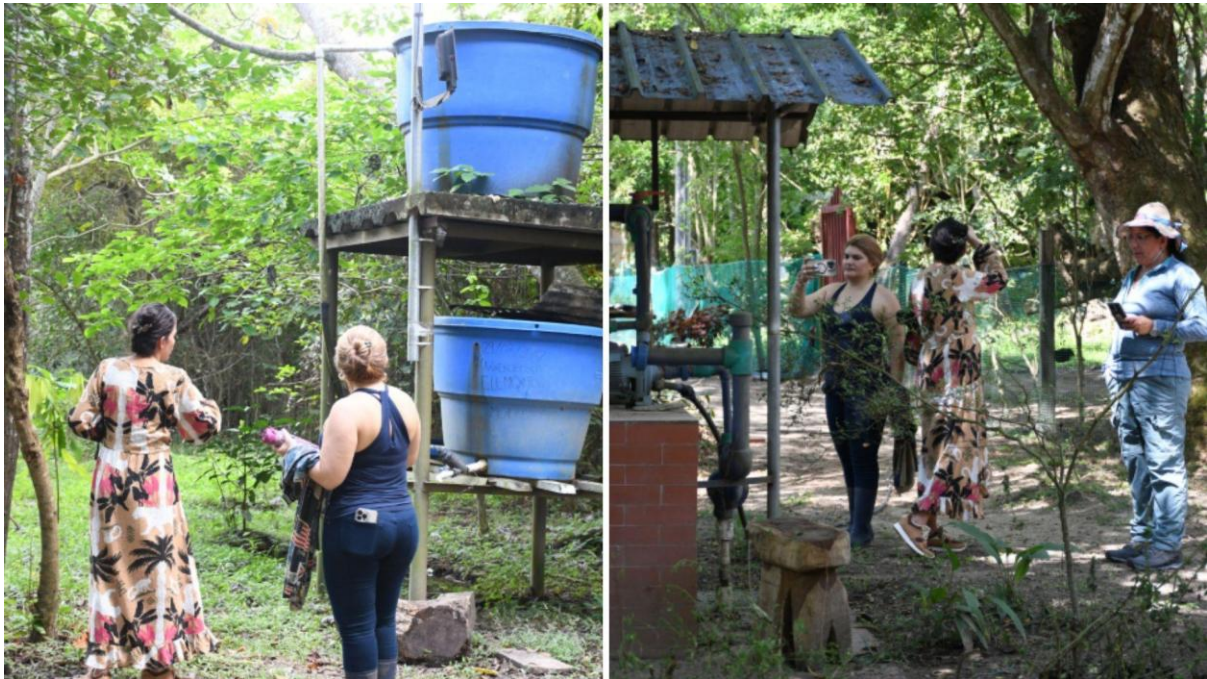
Biodigestor para la producción de biogás en la granja experimental de la sede Orinoquia.

Durante el recorrido por la granja experimental, también se presentaron algunas de las actividades productivas que se desarrollan en este espacio como parte de los procesos de formación, investigación y extensión de la universidad. En particular, se destacaron las unidades de producción avícola y porcina, donde se crían aves y cerdos con fines académicos, investigativos y productivos. En estos espacios, los participantes pudieron conocer las condiciones de manejo, alimentación y cuidado de los animales, así como los sistemas implementados para garantizar su bienestar y el adecuado funcionamiento de las unidades productivas. Asimismo, se explicó la importancia de estos sistemas dentro de los procesos de enseñanza relacionados con la producción animal, la sostenibilidad rural y el aprovechamiento de residuos orgánicos, ya que los subproductos generados en estas actividades pueden ser incorporados en procesos de compostaje o utilizados en otras estrategias de valorización de residuos dentro de la granja experimental. Estas prácticas permiten a estudiantes e investigadores desarrollar experiencias aplicadas y comprender el funcionamiento de los sistemas productivos en el contexto de la región de la Orinoquia.