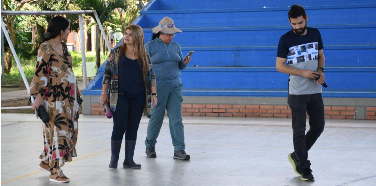
Recorrido por las instalaciones deportivas del campus Orinoquia.

El recorrido incluyó la visita a diversas áreas orientadas al bienestar y la formación integral de la comunidad universitaria. Entre ellas se destacaron las zonas de bienestar universitario, donde se desarrollan actividades orientadas al acompañamiento estudiantil, la promoción de la salud y el fortalecimiento de la convivencia dentro del campus. Asimismo, los participantes visitaron la biblioteca de la sede, un espacio fundamental para el desarrollo académico y la investigación, donde se presentaron los recursos bibliográficos y las herramientas de apoyo al aprendizaje disponibles para estudiantes y docentes.