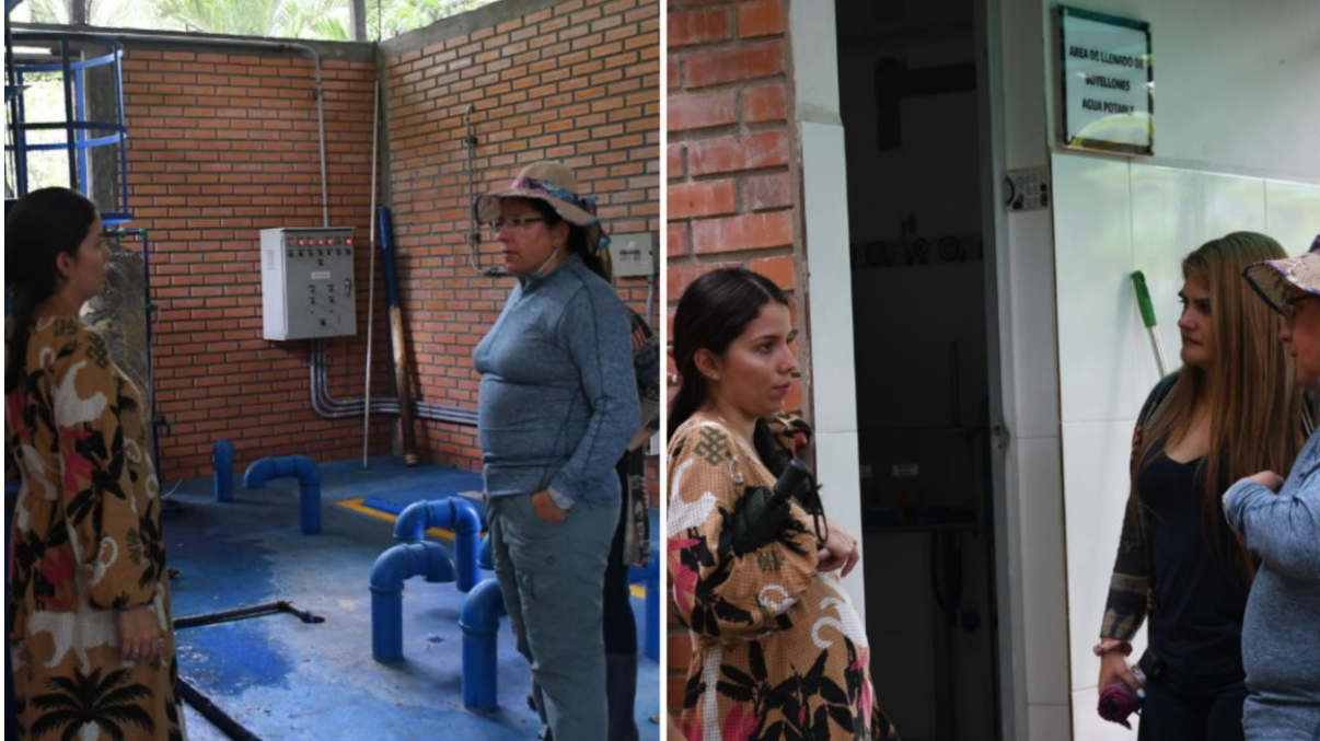
Visita a la planta de potabilización de agua de la Universidad Nacional de Colombia, sede Orinoquia.