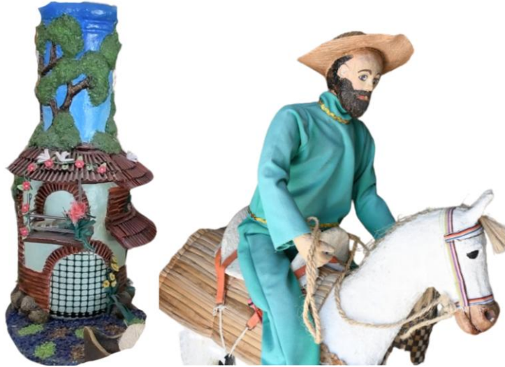
Artesanías elaboradas a partir de materiales reciclados como botellas plásticas, vidrio, cartón y papel reutilizado.

Otro elemento clave de su trabajo es el enfoque educativo y ambiental que desarrolla con niños y jóvenes de la comunidad.